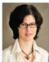
Автор проекта: архитектор Юлия Лемон (Студия интерьерного дизайна LemonLine )

У данного интерьера самая обычная предыстория — молодая семья приобрела квартиру в новом панельном доме. Двое взрослых и двое малышей — мальчик и девочка — с трудом могли разместиться в небольшой двухкомнатной квартире. О перепланировке, учитывая конструкцию здания, речь не шла.